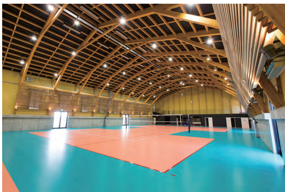
地場産材、地元施工での大規模木造建築