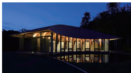
夜景、盆の行事を行う水盤