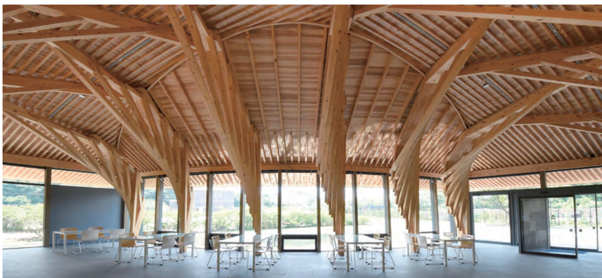
相持ち構成の6組の組柱

ました。ともすると立体的な接合が発生し複雑な加工や組み立てが発生しがちなデザインに対して、正角材を単純なルールによって動かすだけで曲面にフィットできるような組柱を離散的に配置し、2次的な屋根構面で包括するようなシンプルな方法に到達したわけです。