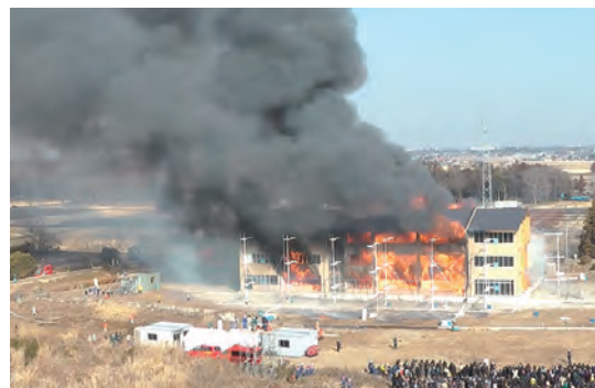
木造3階建て学校火災実験