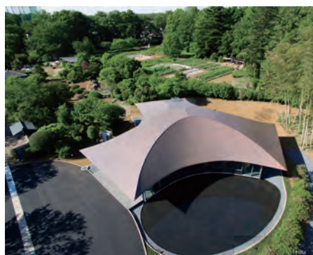
三方向へ広がる屋根を俯瞰

木質化への流れは、グローバル化における文化的均質化に対するひとつの表れとも言えるのではないのでしょうか。今後も様々な技術が、木材料を工学的に、また安定的な使用を実現して行くと思います。その中で、地域由来（日本固有）の風土を引き受けていくようなデザイン、木の使い方が求められていくのではないかと考えています。図はいくつかの試みです。仕組みや成り立ちが感じられるデザインに日本的な感性の一端があるのではないかと考えています。