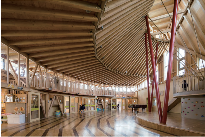
木に鉄骨を組み合わせた吊り構造の屋根