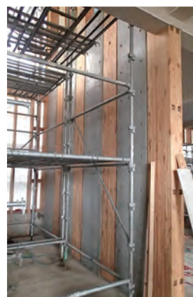
木にRCを組み合わせた楕型耐震壁

木質材料という素材は、それを構造として成立させるのに多くの配慮が必要な素材である。近年、設計法も含めてその発展が目覚ましいが、素材のポテンシャルを引き出し、社会の中に具体的な空間として定着させるためには、構造・構法をハイレベル、ハイテク的な方向に昇華させるのと同時に、すでに一般的な技術をうまく組み合わせて、扱いやすく、安全性を高めた技術とすることが個々の物件でのコストをおさめることや、ひいては技術の水平展開をする視点のうえでも重要である。こうした視点で筆者の設計した地方の工務店と作るローコスト建築や、児童施設の設計例を紹介した。これらの空間の実現においては、木構造にRC造や鉄骨造による一般的な技術を部分的に組み合わせることで、地場での施工を無理のないものとすることや、また、木構造が持つ不確実性に対する安全性を高めることを試みている。