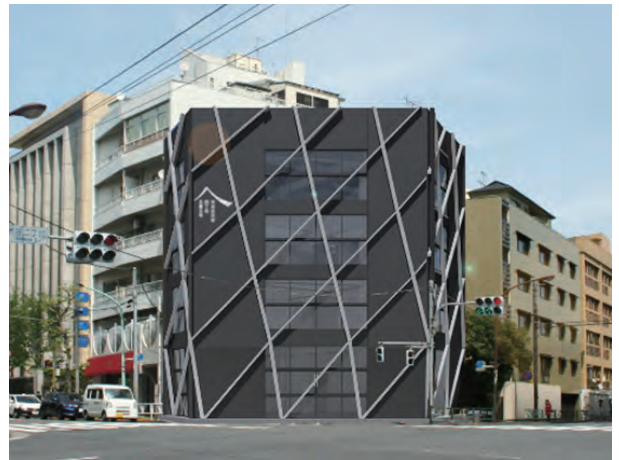
事務所ビルの改修計画