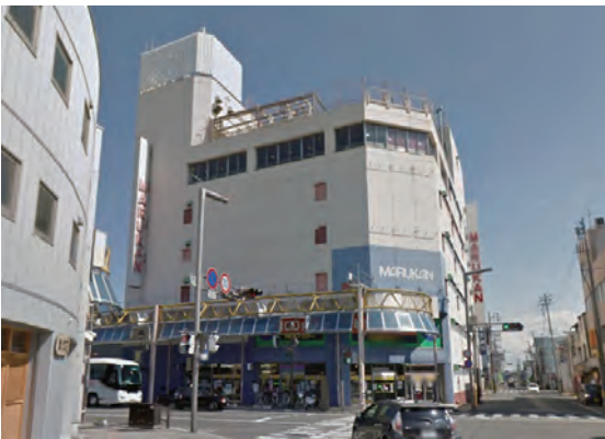
地方での改修物件（デパート）

建築構造を考える際の素材は通常、鉄骨や鉄筋・コンクリート、木といった材料を指す。しかし、人口減少局面に入った日本ではすでに新築の需要はピークを過ぎ、すでにある建築ストックの活用に向けてエンジニアが関与することも必須となりつつある。この際の構造の扱う素材は個々の建築材料についてはもちろんであるが、既存の建築物自体も素材として扱うこととなる。この観点での素材となる建築物は物理的な与条件とともに社会的な与条件も伴っており、多くの場合、それらは相互に絡み合った問題を抱えていることが多い。それ故に、構造設計は建物のもつ背景を読み解き、それらの絡み合った問題をできるだけ平行に解決できる提案をすることが求められる。このような視点をもとに筆者の関わった都心にある社屋ビルや、