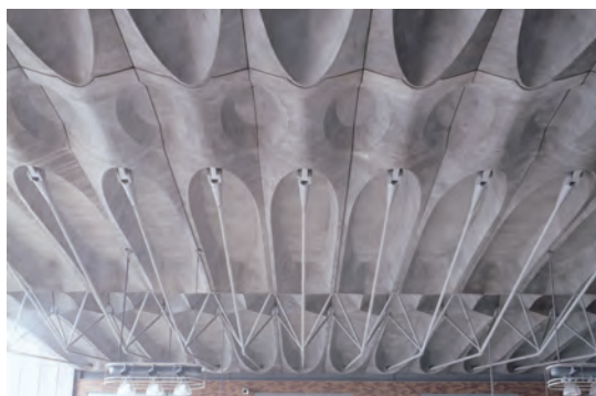
唐戸市場 PC 版屋根

齋藤先生との出会いは、バブルの残滓が漂う1992年、熊本ドームのコンペでの協働（池原義郎建築設計事務所スタッフ）でした。池原先生のもと修業時代にあった自分は、モノ志向もあって、各所のジョイントを担当。コンペでは施工提案が求められていたこともあり、齋藤先生の指導のもと、建て方から上棟、完成に至るまでの形状に追従するメカニズム、動くジョイント機構に取組んだわけです。これを契機に、齋藤先生との協働で唐戸市場が生まれた。唐戸ではプレキャストコンクリートと吊り構造をハイブリッドした形式が採用され、建て方時からの動く機構に加えて、逆工程解析の先進性、張力導入の形状と張力による制御の難しさ、内在する力の魅力に触れることとなった。そこに一貫していたものは齋藤先生の「仕組みへの眼差し」であったと思う。新しいことへの挑戦に必要なものは「仕組みへの眼差し」ある種の直感、好奇心ではないだろうか。その後、国土交通省との共同で行われた「火災実験」に参画。部材単位の性質と、それが集積してひとつの建築となった際の性状を、単純に予測出来ない難しさに、木質ならではのものを学びました。一般的には、「太い」「長い」材を得られる大断面集成材やLVLなどの接着系木質材料を使うと、大空間を解きやすくなりますが、設備の整った一部メーカーからしか材料が調達できなくなるなどの課題もあり、もっと汎用性がある、工夫の余地もある一般製材の活用を条件として、次のプロジェクト「梅郷礼拝堂」に取組んだわけです。